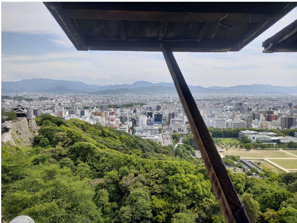
Poze din excursia noastră spre Castelul Matsuyama

Negrea Cristina-Maria, JA-EN, an III Universitatea Ehime, perioada: 1 semestru (4 luni)