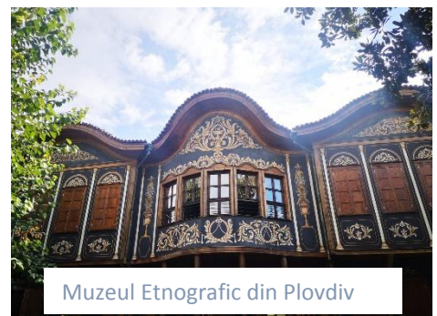
Muzeul Etnografic din Plovdiv

În a treia zi, am mers într-o călătorie către Plovdiv, un oraș aflat la 2 ore de Sofia. Ajunși acolo, am vizitat Muzeul Etnografic. Imediat după prânz am pornit într-o „vânătoare de